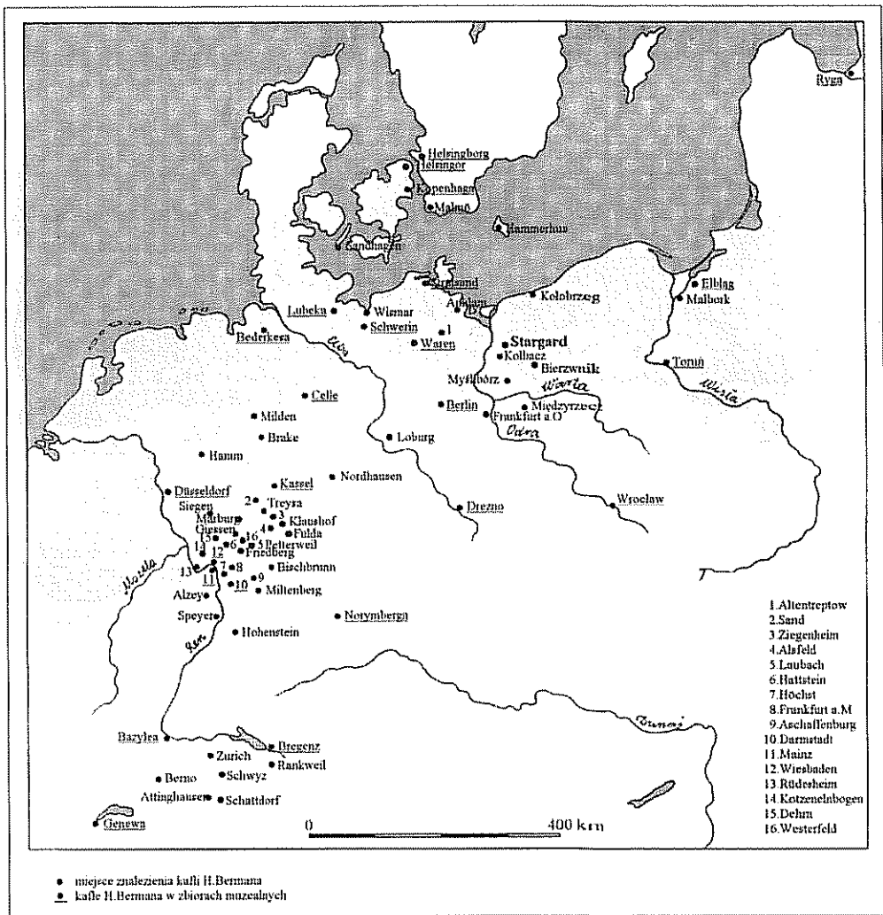
Ilustr. 4. Mapa znalezisk kufli z warsztatu H. Bermana, wg R. Fritsch z uzupełnieniami autora