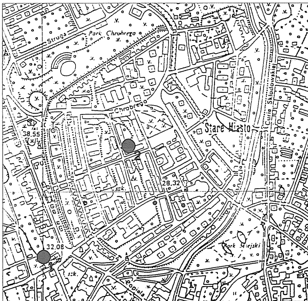
Ilustr. 1. Stargard. Lokalizacja znalezisk kafli z warsztatu H. Bermana, rys. R. Kamiński